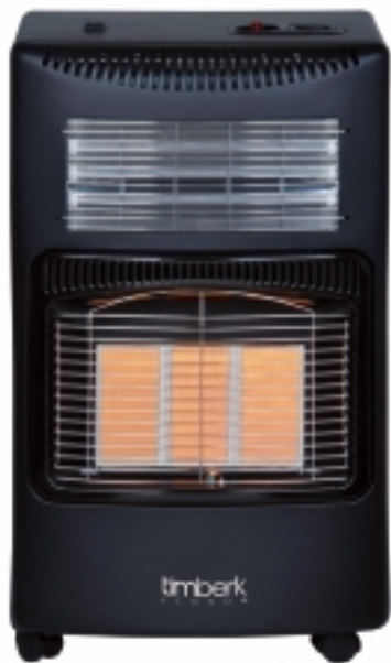
На рисунке: модель TGH 4200 M2